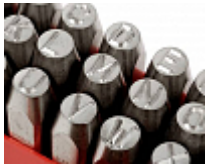
Handwerkzeuge zur Kennzeichnung und Identifikation