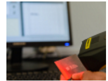
Überwachung von Produktionsdaten