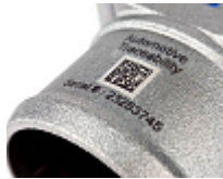
Markieren von Seriennummern