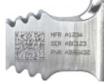
Markierungsstandards für die Luft- und Raumfahrt