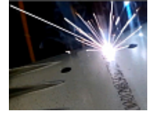
Markierung von Fahrgestellnummern